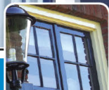
verwerk / peinture