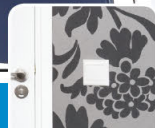
behang / papier peint