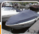
dekzeil / bâche