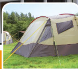
tenten / tentes