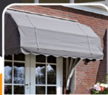
zonnescherm / marquise